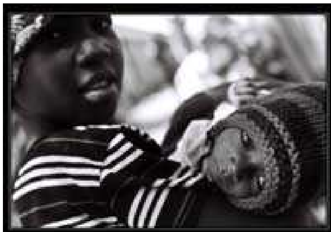
Même en Afrique, les plus petits doivent être réchauffés.

Nous avons eu le bonheur de recevoir un don en lait de Nestlé® pour le Centre de Récupération et d'Éducation Nutritionnelle , qui accueille les enfants en cas de malnutrition sévère ou modérée à l'issue de leur séjour au service de pédiatrie. Pendant la phase de récupération nutritionnelle (visant à une prise de poids rapide sur 4 semaines par un régime hypercalorique et hyper protéiné conforme aux protocoles de l'OMS), une solide éducation des accompagnantes aux bonnes pratiques en nutrition (préparation de bouillies enrichies), hygiène, santé de l'enfant, espacement des naissances, est donnée pour assurer le retour à domicile et le maintien de la prise du poids. Notre association permet enfin au Dr. Zala