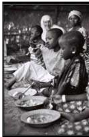
Enfants sous la paillote