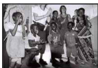
Séance de chant... le crocodile.