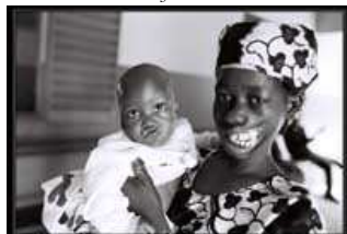
Un des jumeaux, trop petit pour cette mission et Saada,, noma, avec constriction totale